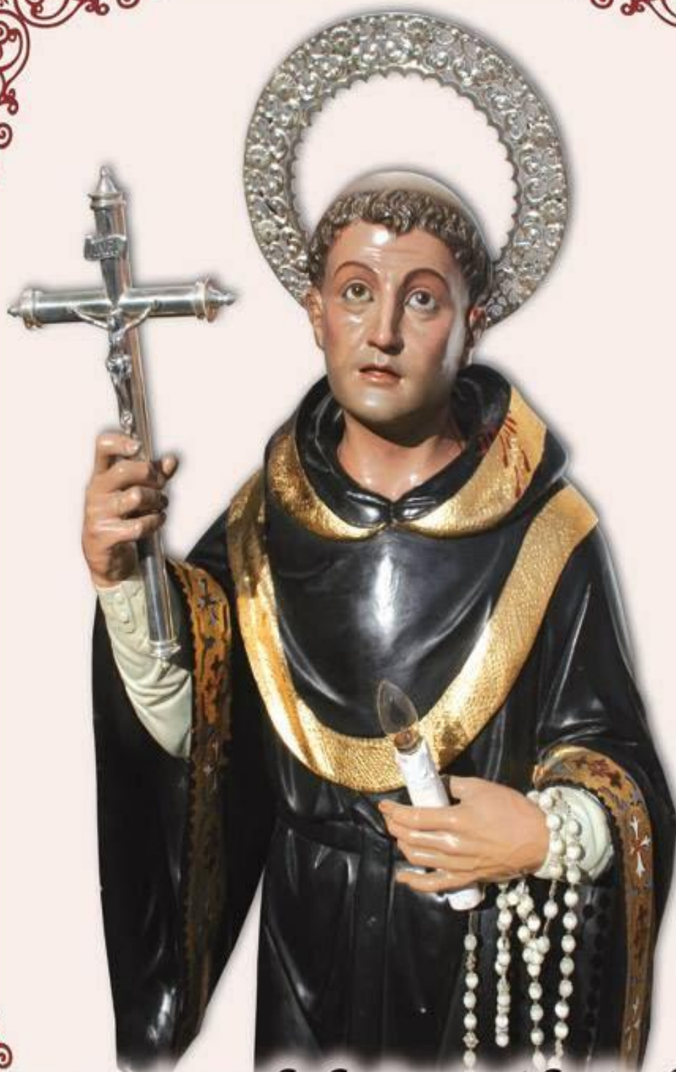
Beato fernando de San José de Ayala Ballesteros de Calatrava